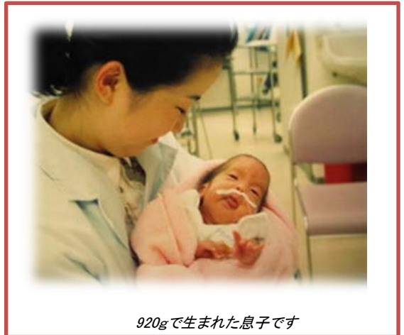
920g で生まれた息子です

今までに小さく生まれた赤ちゃんの他、心臓にご病気のある赤ちゃん、18 トリソミーの赤ちゃんのママに喜んでいただいています。感染症予防の面でも身体にいろいろな器具がついていても着ることができるタイプですので、ぜひ、多くの赤ちゃんに使っていただきたいと思っております。サンプルもご用意しておりますので、お気軽にお問合せください。